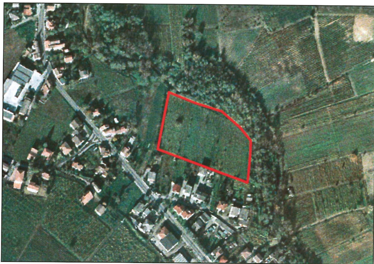
Figura 2 – localizzazione dell'area di intervento su foto aerea